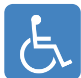
a) Branco sobre fundo azul