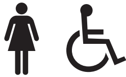
Sanitário feminino acessível