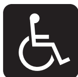
b) Branco sobre fundo preto