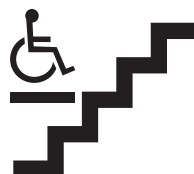
Escada com plataforma móvel