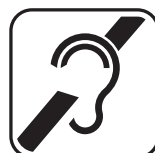
c) Preto sobre fundo branco

Esse símbolo deve ser utilizado em todos os locais, equipamentos, produtos, procedimentos ou serviços para as pessoas com deficiência auditiva.