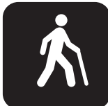
b) Branco sobre fundo preto