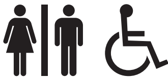
Sanitário masculino e feminino acessíveis