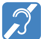
a) Branco sobre fundo azul