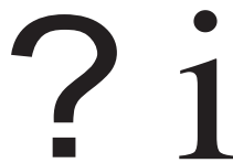
Símbolos Internacionais de Informação