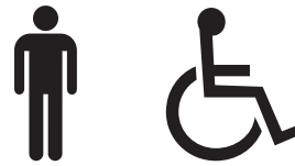
Sanitário masculino acessível