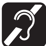
b) Branco sobre fundo preto