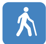
a) Branco sobre fundo azul