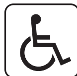
c) Preto sobre fundo branco

Este símbolo indica a acessibilidade das edificações, mobiliários, espaços e equipamentos urbanos onde existem elementos acessíveis ou utilizáveis por pessoas com deficiência ou mobilidade reduzida.