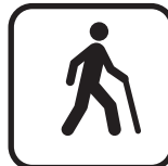
c) Preto sobre fundo branco

Esse símbolo deve indicar a existência de equipamentos, mobiliário e serviços para as pessoas com deficiência visual.