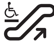
Escada rolante com degrau para cadeira de rodas